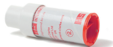
EMBOUT AVEC ADAPTATEUR ENFANT